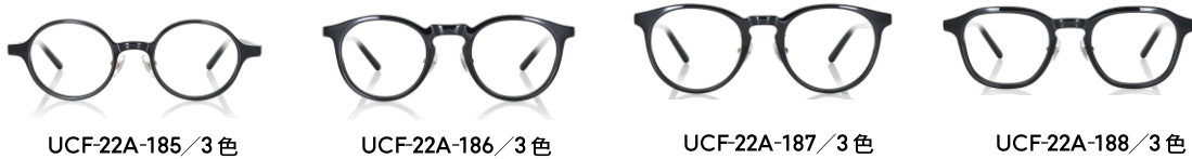
UCF-22A-185 / 3色